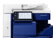
FINISHER INTERNO A2 4 0