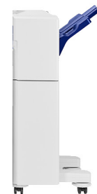
FINISHER B4 2 0