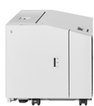
B2 ALIMENTATORE AD ALTA CAPACITÀ 2,940 fogli